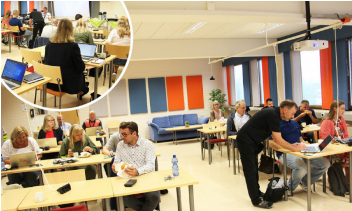
Uusi organisaatio aloitti toimintansa yhteisellä suunnittelupäivällä 1.8.2023.